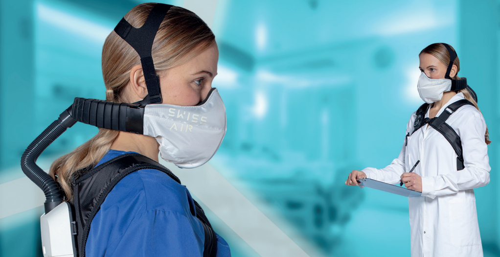
Applicazioni mediche / assistenza sanitaria