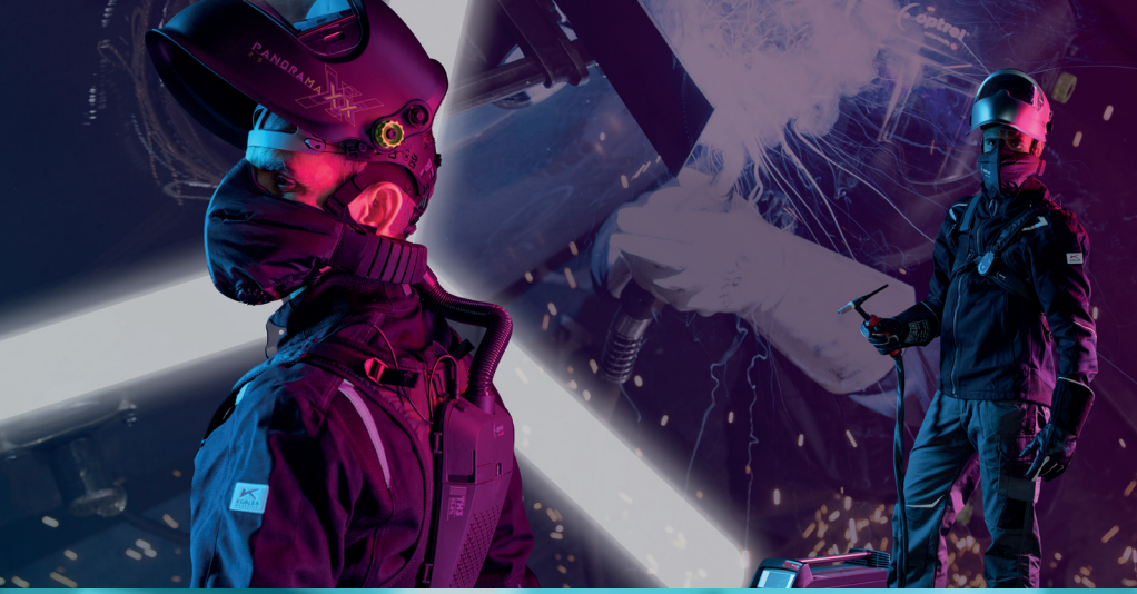
Saldatura / Taglio al plasma