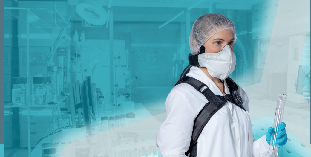
Applicazioni di laboratorio / industria farmaceutica