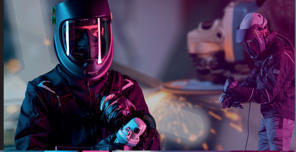
Molatura / lavorazione dei metalli / lavorazione del legno / applicazioni industriali