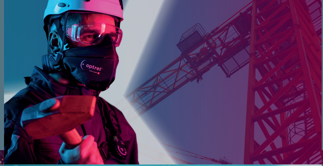
Demolizione / Costruzione / Agricoltura / Smaltimento rifiuti / Riciclaggio